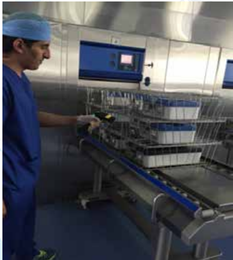
أجهزة التعقيم بالبلازما